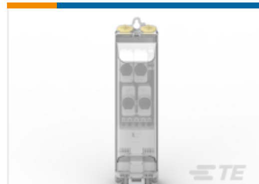
TE 产品编号820560-000 EKM-2051-4D1-5S/U-RK