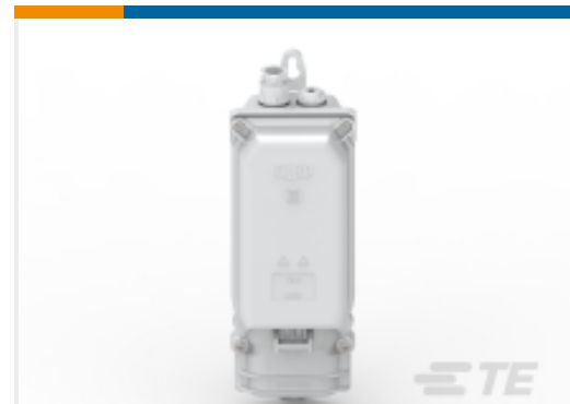
TE 产品编号523562-000 EKM-1281S-2D1-5S/U-2PG-C2