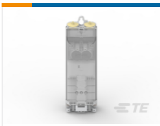
TE 产品编号CS0588-000 EKM-2050-2D1-3S/C-6-E1