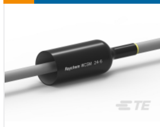
TE 产品编号135998-1 WCSM-24/6-1000/S(S20)