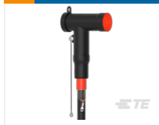
TE 产品编号CM0012-005 RSTI-5854