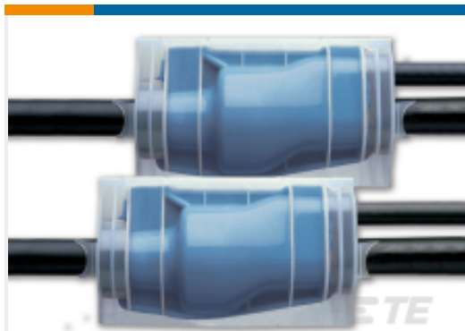
TE 产品编号F24445-000 RAPID-3-D245