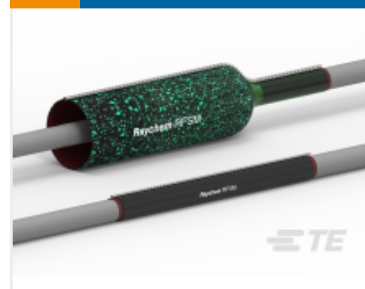
TE 产品编号186312-000 RFSM-95/30-750/123