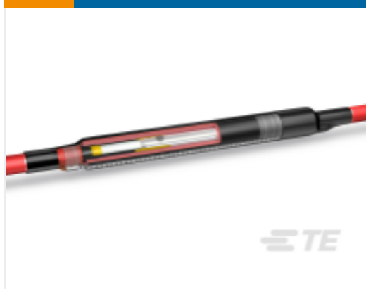
TE 产品编号CM2386-005 MXSU-L MV 维修接头