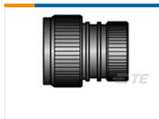
TE 产品编号527781-000 HEX40-AC-00-15-A5-1