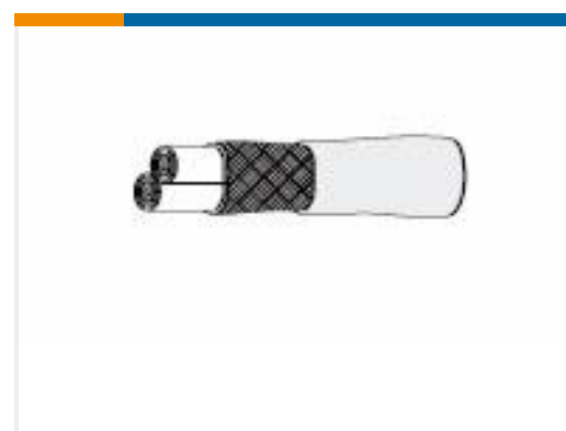
TE 产品编号272103-000 55A1123-20-9/96-9CS2275