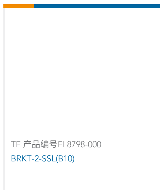
TE 产品编号EL8798-000 BRKT-2-SSL(B10)