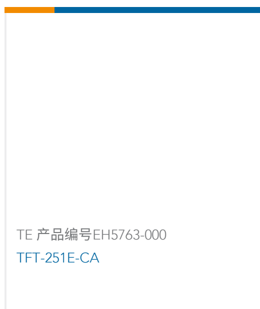
TE 产品编号EH5763-000 TFT-251E-CA