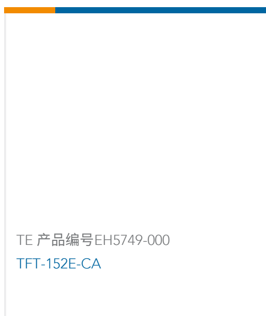
TE 产品编号EH5749-000 TFT-152E-CA