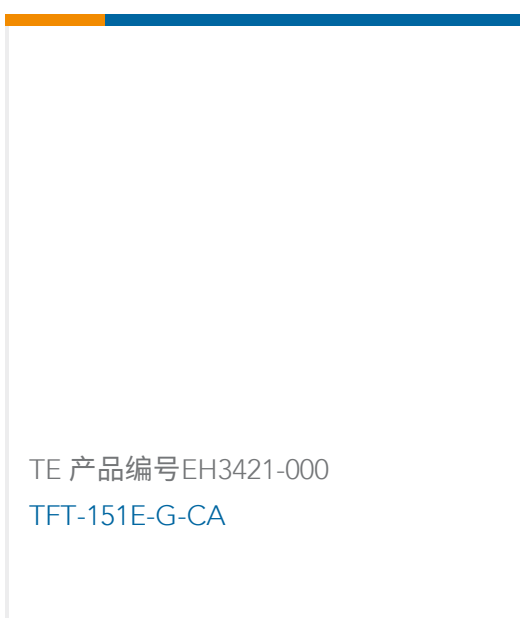
TE 产品编号EH3421-000 TFT-151E-G-CA