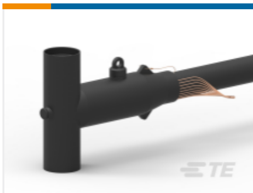
TE 产品编号CZ1578-000 ELB-600-CES-GRD-1