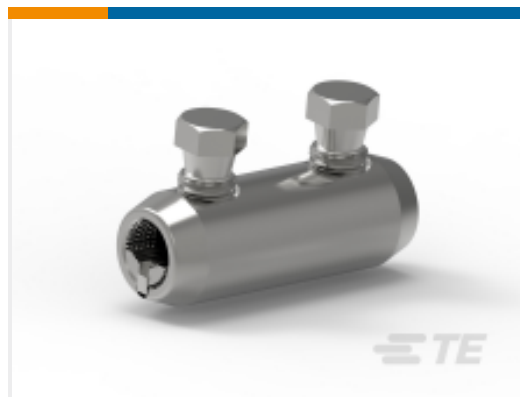
TE 产品编号1574846-4 ASBS-2-3/0