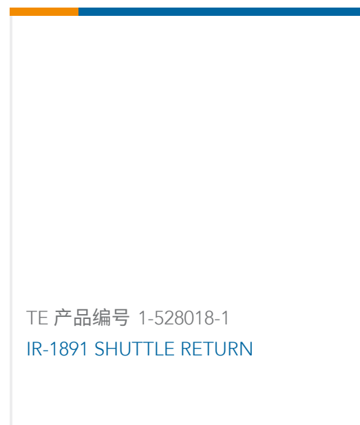
TE 产品编号 1-528018-1 IR-1891 SHUTTLE RETURN