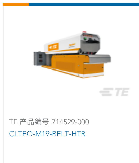
TE 产品编号 714529-000 CLTEQ-M19-BELT-HTR