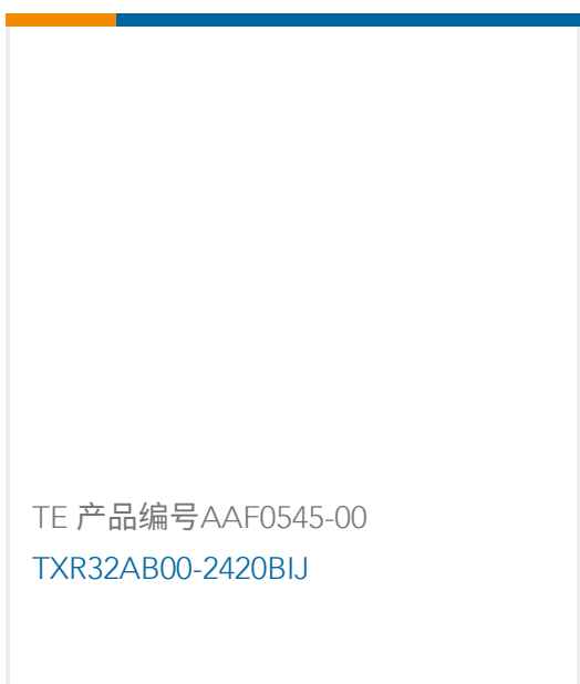
TE 产品编号AAF0545-00 TXR32AB00-2420BIJ