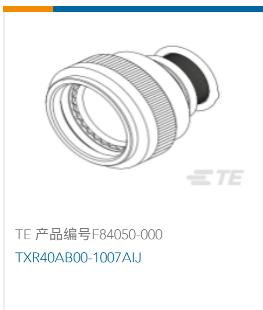
TE 产品编号F84050-000 TXR40AB00-1007AIJ