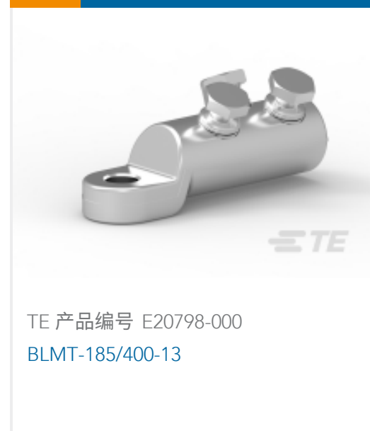
TE 产品编号 E20798-000 BLMT-185/400-13