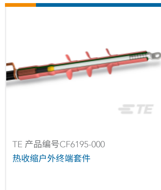
TE 产品编号CF6195-000 热收缩户外终端套件