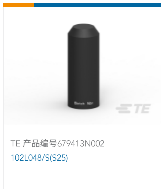
TE 产品编号679413N002 102L048/S(S25)