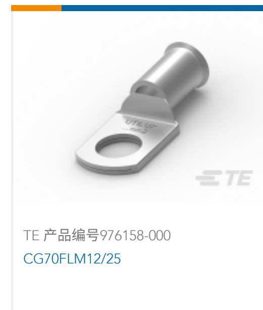
TE 产品编号976158-000 CG70FLM12/25