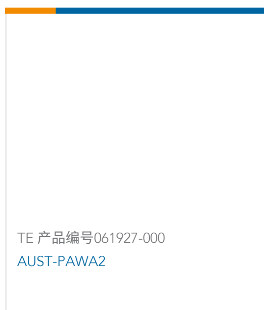
TE 产品编号061927-000 AUST-PAWA2