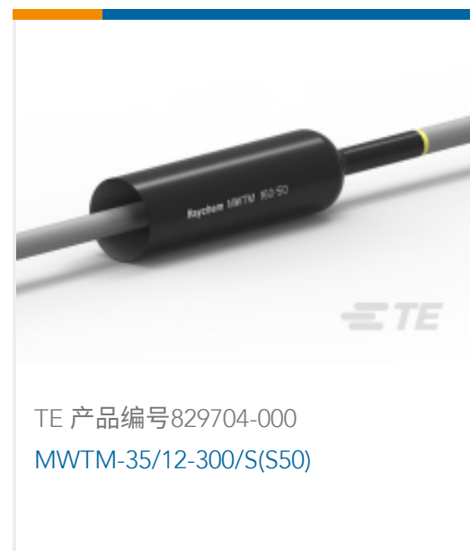
TE 产品编号829704-000 MWMTM-35/12-300/S(S50)