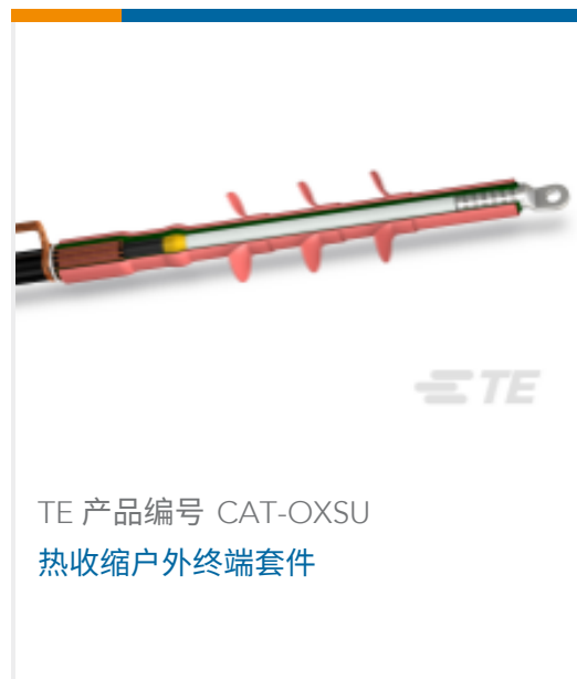
TE 产品编号 CAT-OXSU 热收缩户外终端套件