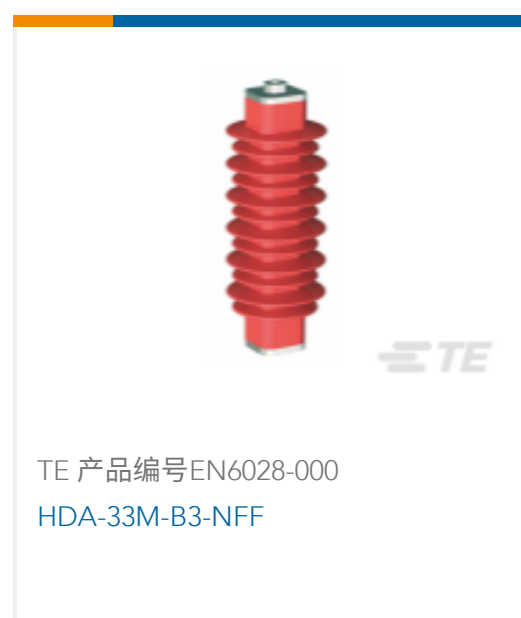
TE 产品编号EN6028-000 HDA-33M-B3-NFF