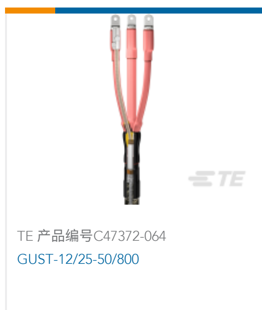
TE 产品编号C47372-064 GUST-12/25-50/800