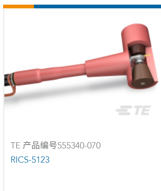
TE 产品编号555340-070 RICS-5123