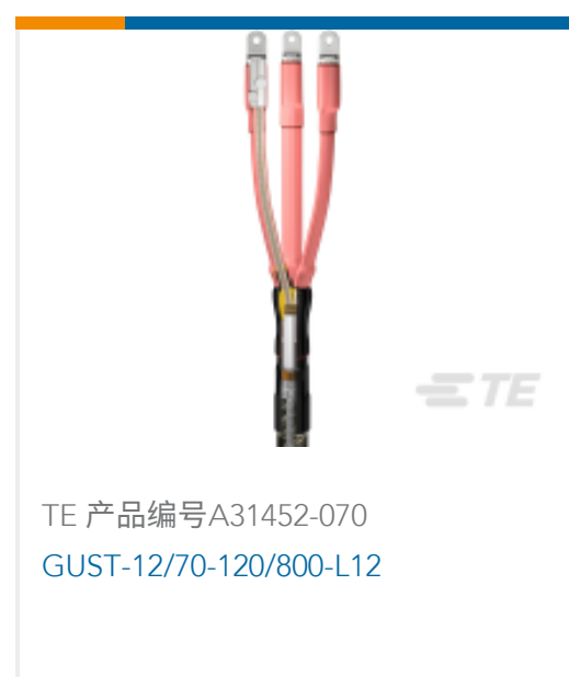
TE 产品编号A31452-070 GUST-12/70-120/800-L12