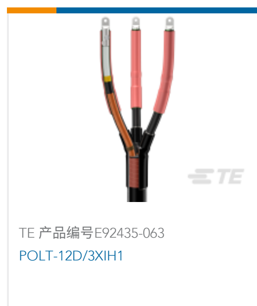
TE 产品编号E92435-063 POLT-12D/3XIH1