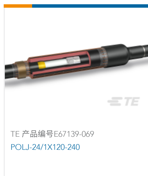
TE 产品编号E67139-069 POLJ-24/1X120-240