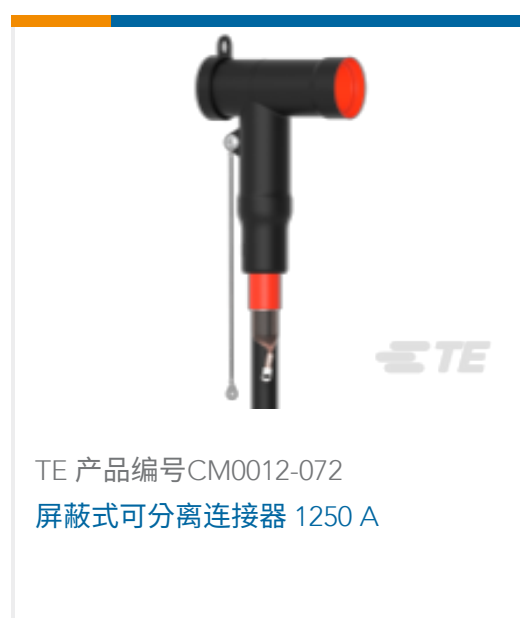
TE 产品编号CM0012-072 屏蔽式可分离连接器 1250 A