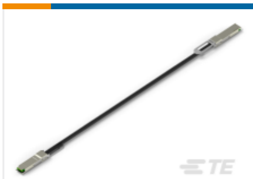
TE 产品编号2333393-7 OSFP 25GIG 30AWG 3 METER