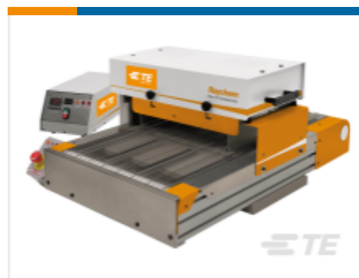
TE 产品编号 2326489-1 MODEL 105 TUNNEL OVEN, 36" ENTRY, STAND A