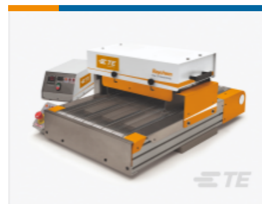
TE 产品编号 955018-000 CLTEQ-M105-TUNNEL-OVEN