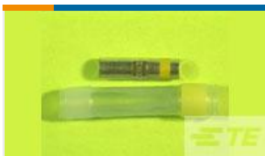
TE 产品编号 650076-000 D-436-38