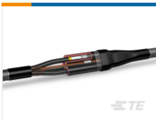
TE 产品编号D11309-070 POLJ-12/3X25-70