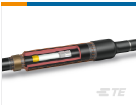
TE 产品编号E67139-069 POLJ-24/1X120-240