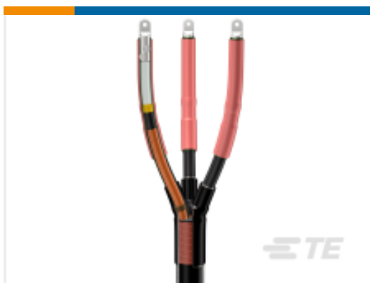
TE 产品编号E92435-063 POLT-12D/3XIH1