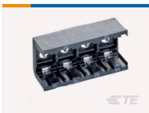
TE 产品编号DCR-1A-06 COMPOSIT RAIL