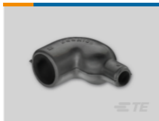
TE 产品编号806823-000 球形热缩护套：有嘴，直角