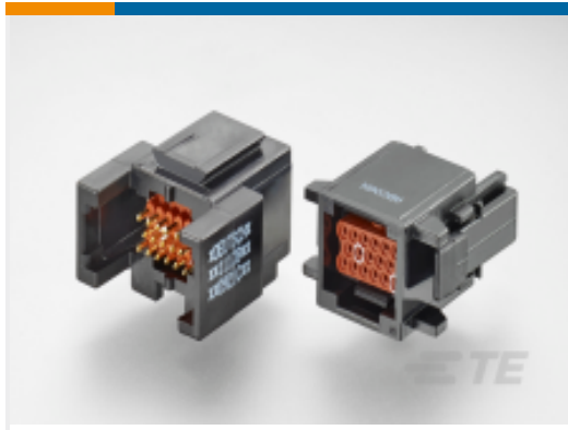
TE 产品编号ABC06N-22P IN-LINE PLUG