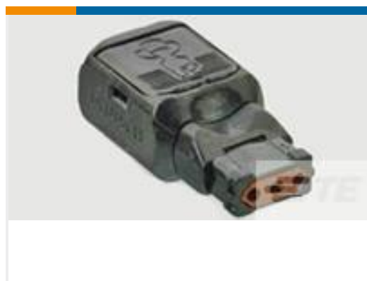
TE 产品编号D369-P33-NS1 369 3 WAY PLUG, CRIMP, SKT