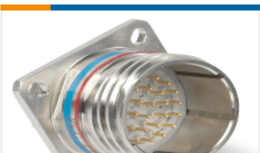
TE 产品编号YDTS20F23-53PNV001 RECP ASSY