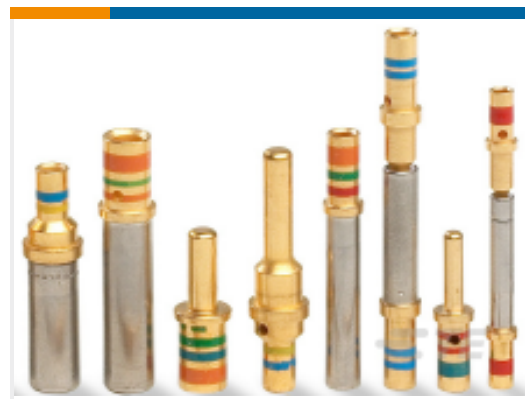
TE 产品编号0641-2-1631L CONT PIN