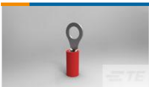
TE 产品编号32837 PIDG R 22-16 COMM 22-18 MIL 10