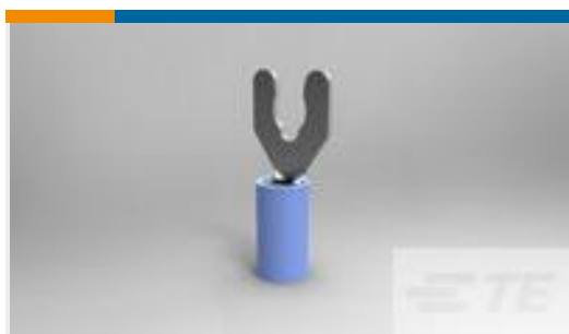
TE 产品编号52936-1 TERMINAL,PIDG SPR SPD 16-14 8