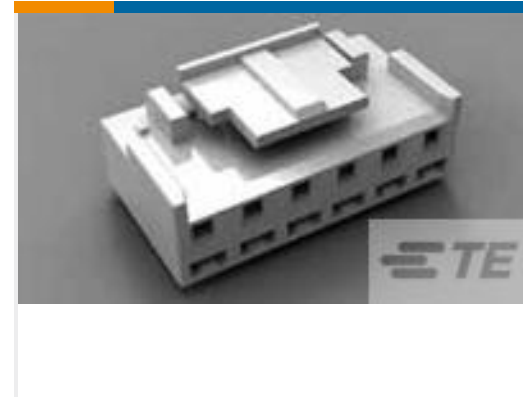
TE 产品编号1-1123722-7 3.96 EP PLUG HSG 7P(NATURAL)