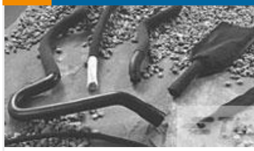
TE 产品编号6979346013 HFT5000-30/15-0-150MM