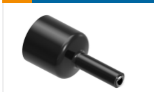
TE 产品编号NB08026001 HTAT-48/13-0-50MM