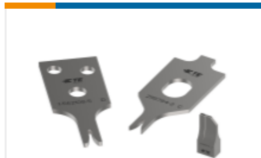
KIT REPRESENTATION ONLY