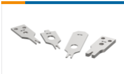
CRIMPER REPRESENTATION ONLY