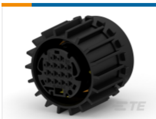
TE 产品编号1703768-1 14POS,AMP MCP1.5K,SOCK HSG, ASSY,10POS