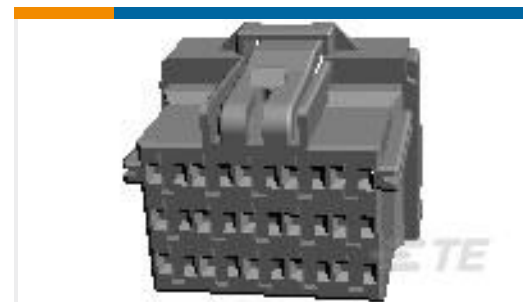
TE 产品编号7-968973-1 AMP MCP 2.8 HSG 15 POS. 2. LOCKING