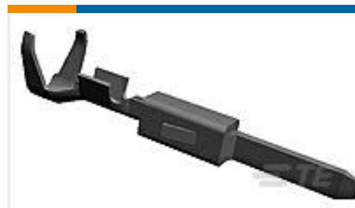
TE 产品编号1703278-5 TAB A 1.6x0.6 CONTACT CS SWS Ag