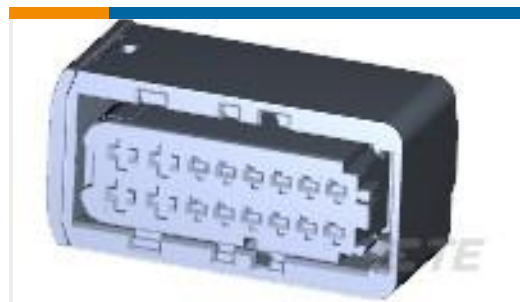
TE 产品编号4-1564337-1 16POS, MIXED, REC HSG, ASSY