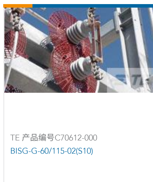
TE 产品编号C70612-000 BISG-G-60/115-02(S10)