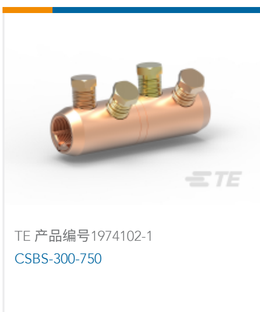
TE 产品编号1974102-1 CSBS-300-750