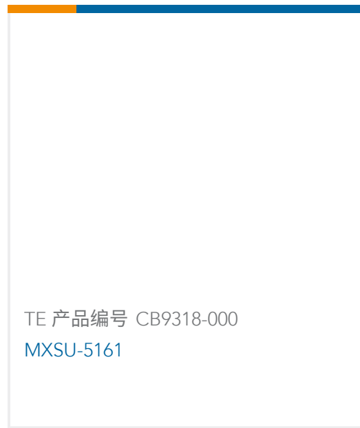
TE 产品编号 CB9318-000 MXSU-5161