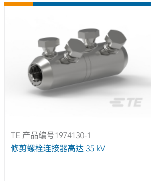
TE 产品编号1974130-1 修剪螺栓连接器高达 35 kV