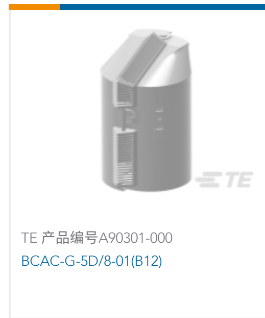
TE 产品编号A90301-000 BCAC-G-5D/8-01(B12)