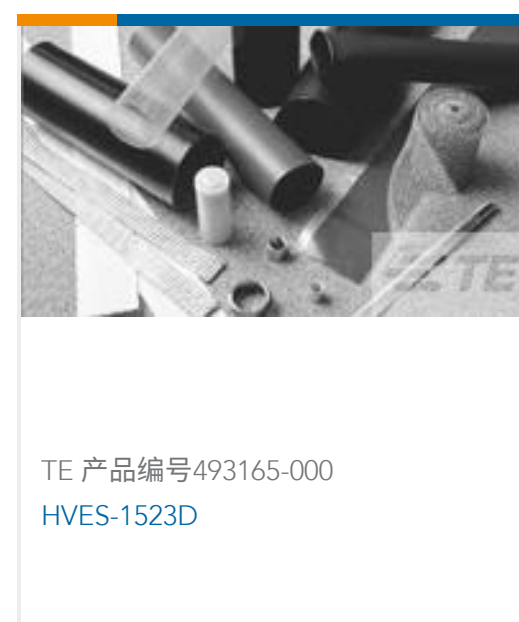
TE 产品编号493165-000 HVES-1523D