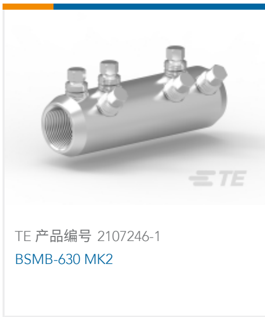
TE 产品编号 2107246-1 BSMB-630 MK2