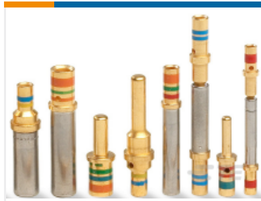
TE 产品编号ZPF000000000000423 006-1169-16