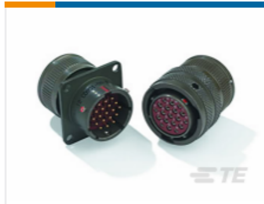
TE 产品编号ZPF0000000000006046 951-00 R 12-3 PY 50