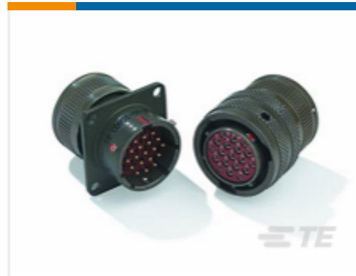
TE 产品编号ZPF0000000000006612 951-06 R 18-32 S 50