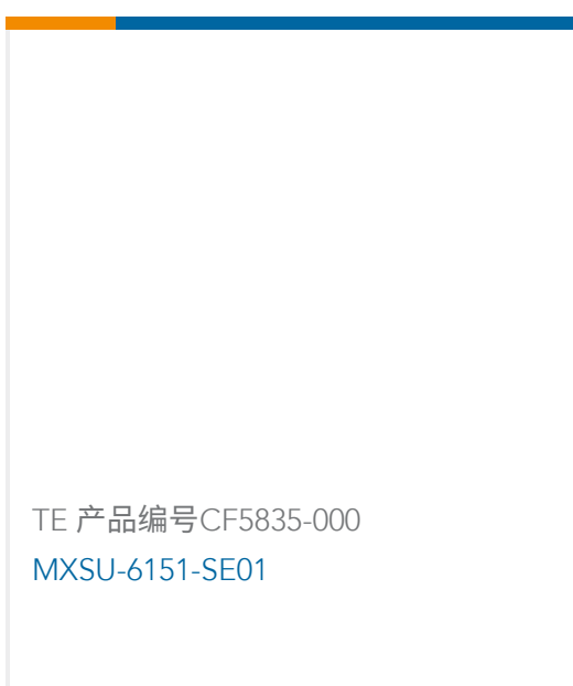
TE 产品编号CF5835-000 MXSU-6151-SE01