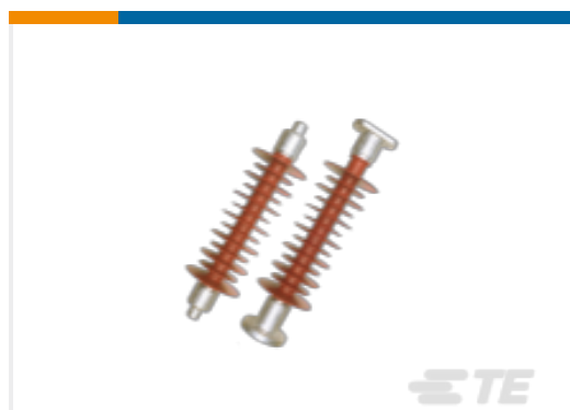
TE 产品编号CB7359-000 RAP-43R-A3S-445