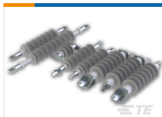
TE 产品编号CB8084-000 RRA-43R-PPG-454-42