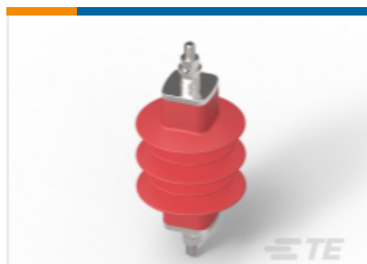
TE 产品编号EN4833-000 中压避雷器