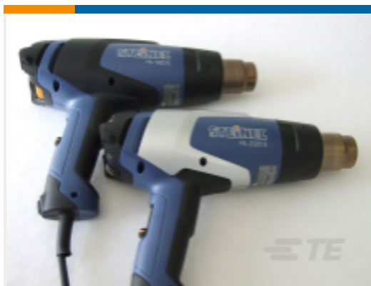
TE 产品编号 EG8162-000 HL1920E-230V-EURO