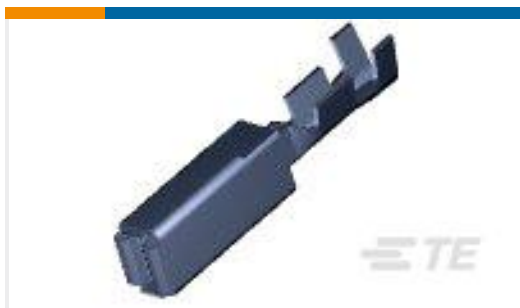
TE 产品编号1-1355876-1 AMP MCP 2.8, CONTACT LANCELESS