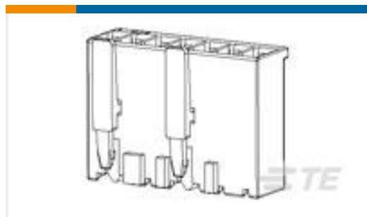
TE 产品编号2-928247-5 STD TIMER GEH 5P