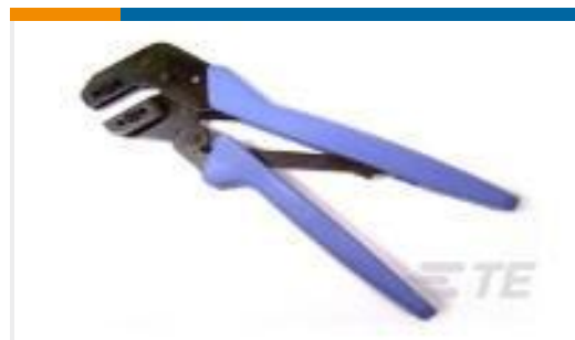
TE 产品编号58508-1 PRO-CRIMPER HD TL W/DIE BUDGET