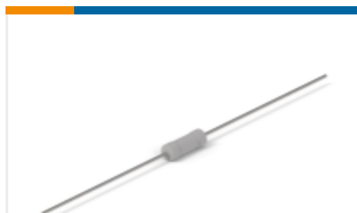
TE 产品编号2-1676123-0 1/2W SM M/OX 5% 5R1