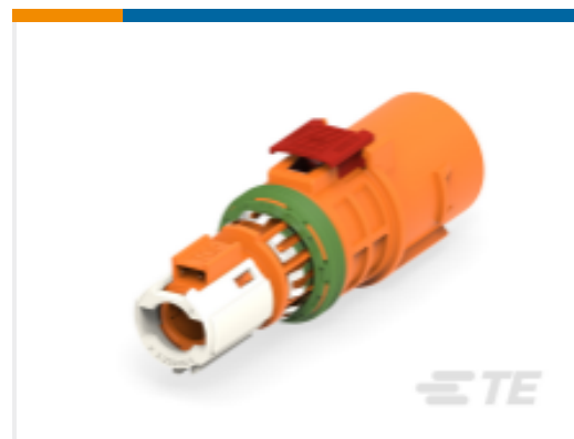
TE 产品编号2-2394085-2 Pre-ASSY,Tool Access,Code B