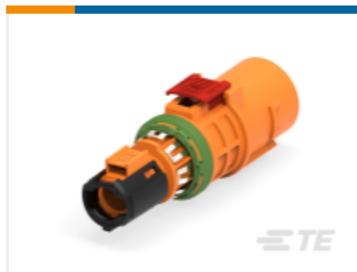
TE 产品编号2-2394085-1 Pre-ASSY,Tool Access,Code A