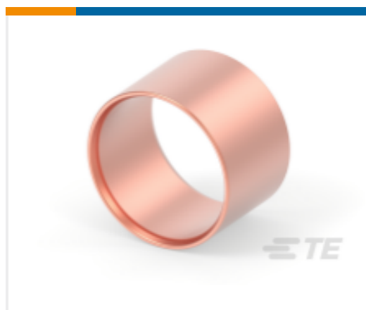
TE 产品编号2371242-1 CU ALLOY,INNER FERRULE,ICT CVE