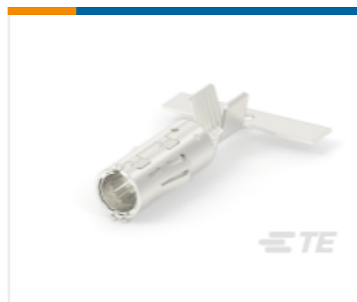
TE 产品编号2-2349177-1 DIA 4MM,PIN TERMINAL,FAM SLD,CB