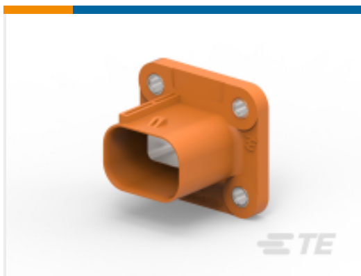
TE 产品编号1-2103247-5 SPLIT HEADER ASSY, Ag, KEY E, HVA280