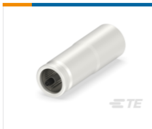
TE 产品编号2383445-2 DIA 10MM,TERMINAL,FAM SLD /UNSLD,CB