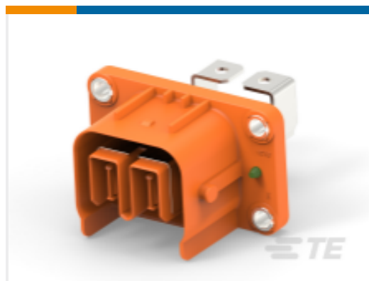
TE 产品编号1-2310224-1 2POS,PCON12,HDR ASSY,COD A,L.V.