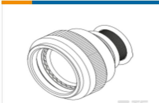
TE 产品编号F84050-000 TXR40AB00-1007AIJ