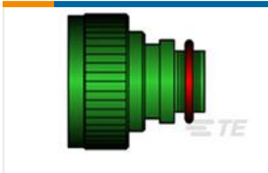
TE 产品编号CF8121-000 TXR40AB00-1814AIJ