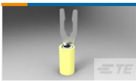
TE 产品编号52430-3 TERMINAL,PIDG SPR SPD 12-10 6