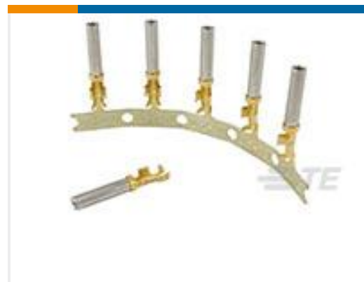
TE 产品编号1062-16-0644 SOC, SF, SIZE 16, 16-20, AU/SN