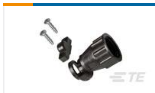
TE 产品编号1-206062-6 CABLE CLAMP KIT #11