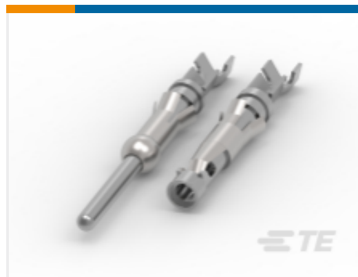
TE 产品编号66602-8 Pin and Socket Contacts, Type III, LP