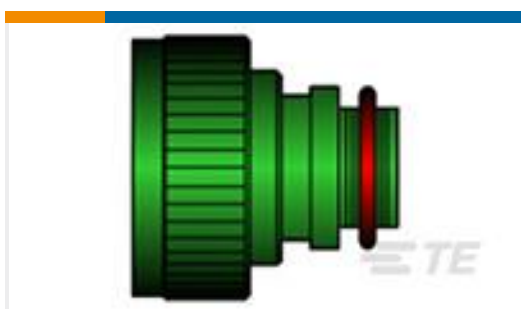
TE 产品编号919073-000 TXR40AC00-1004AI