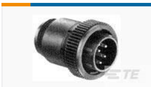
TE 产品编号211768-1 CPC PLUG ASSEMBLY SIZE 17-9