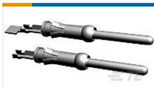
TE 产品编号1-66400-0 III+ PIN,24-20,TIN,LP