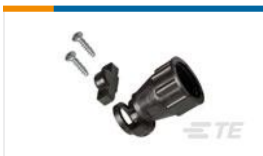
TE 产品编号1-206062-6 CABLE CLAMP KIT #11