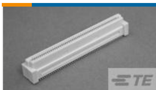
TE 产品编号5-5179180-4 0.8FH,R09H.5,100,08/Sn,TR,SC