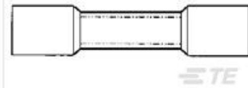
TE 产品编号55845-1 #8 PRE-INSUL SEALED SPLICE