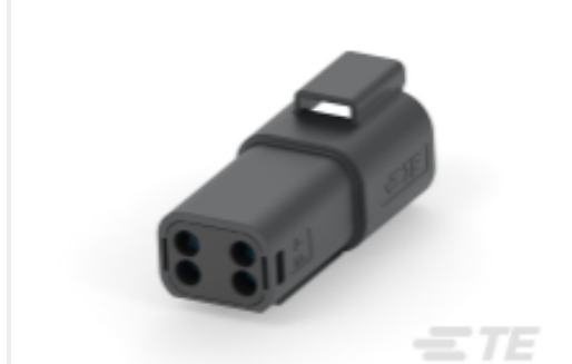
TE 产品编号1-2600030-0 4CCT BLACK RECEP W/LARGE SEAL