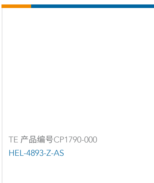
TE 产品编号CP1790-000 HEL-4893-Z-AS