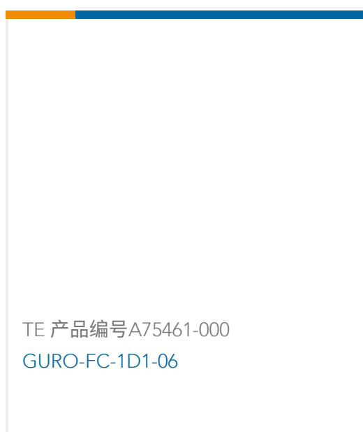
TE 产品编号A75461-000 GURO-FC-1D1-06