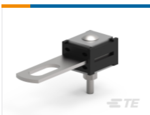
TE 产品编号250760-000 HEL-3932