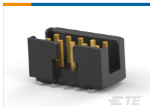
TE 产品编号1-2373376-0 10P,2MM,SHRD HDR,DRV,T,SMD,0.1 AU,TB