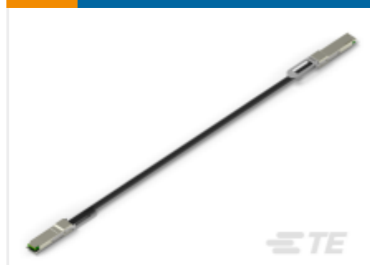
TE 产品编号2333393-7 QSFP 25GIG 30AWG 3 METER