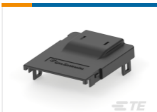
TE 产品编号1986186-1 Strain Relief,20 Posn,D3000 Dynamic, 2