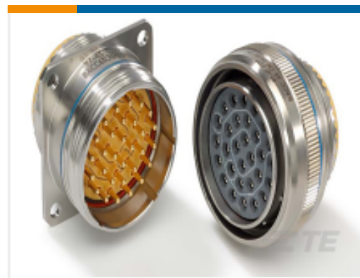
TE 产品编号 ZPF00000000105618 983-6R 08-03 SN-A246