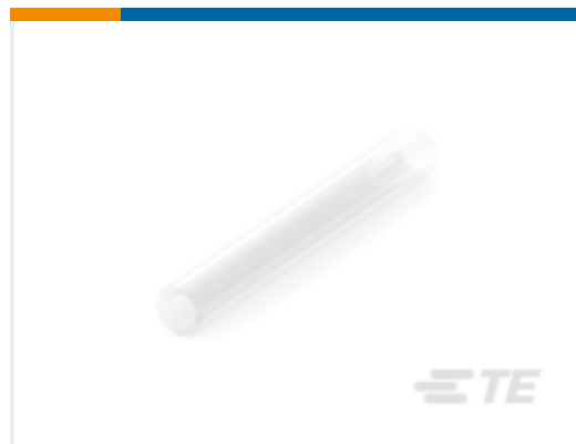
TE 产品编号 NB15372001 CRN-3/32-X-STK