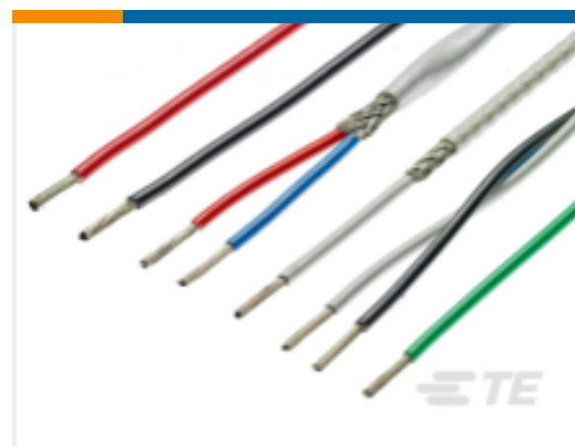
TE 产品编号 CQ92453001 44A0321-14-0/9CK0202/2