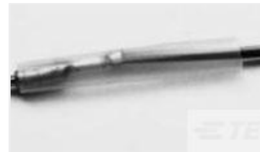
TE 产品编号CV21424001 RW-175-E-1/8-X-SP