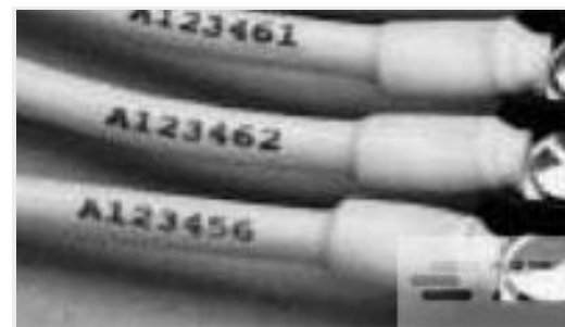
TE 产品编号5052964022 RNF-100-3/32-4-SP