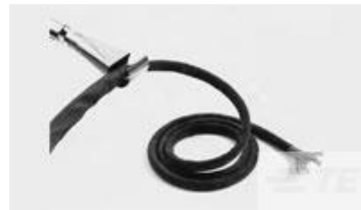
TE 产品编号CB03354011 RW-200-E-3/8-0-SP