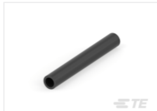
TE 产品编号CAT-HST-RBKILS RBK-ILS 热缩管