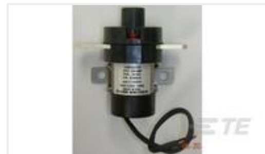
TE 产品编号5-1616970-9 K200A1C=CONTACTOR 200 AMP SPST 28 VDC