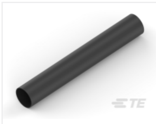
TE 产品编号NB10076001 ATUM-24/6-0-65MM