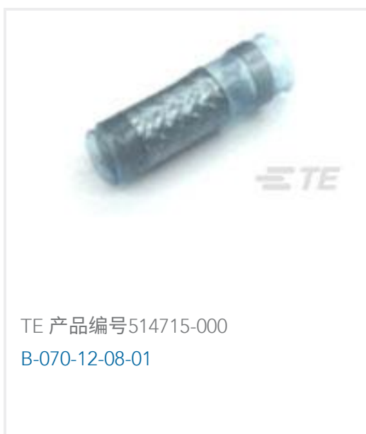
TE 产品编号514715-000 B-070-12-08-01