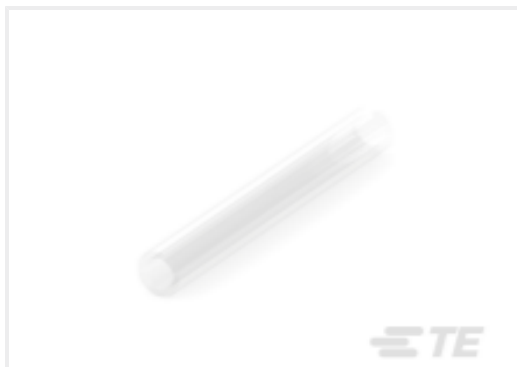
TE 产品编号NB15372001 CRN-3/32-X-STK