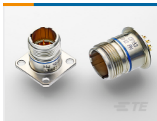
TE 产品编号ZPF0000000000200102 983-1Y 10-12 PN