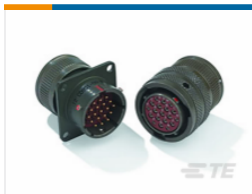
TE 产品编号ZPF000000000006773 951-06 RC 20-41 SW 50