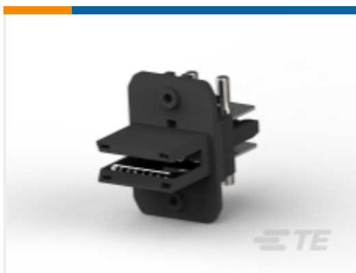
TE 产品编号2204866-1 RACK 500A (250+&250-) ORV2 Output Conn