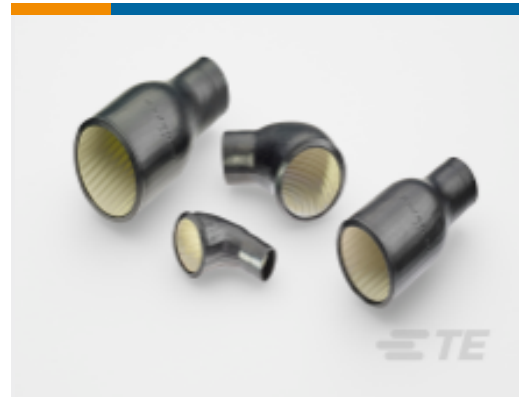
TE 产品编号EK7286-000 202S163-25C-0