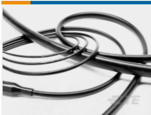
TE 产品编号CB03434010 单厚壁 RW 200 E : 热缩管 , 2:1 收缩比