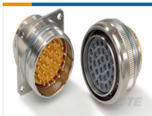
TE 产品编号ZPF000000000007999 983-1Y 08-03 PN