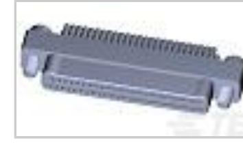
TMN2N051PC2DX018S = M32139/03-G02SNS