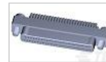
TMN2N051PC2DT036S = M32139/03-G09SNS