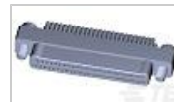
TMN2N051PC2DT018S = M32139/03-G08SNS