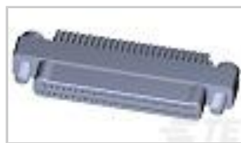
TMN2N051PC2DM018S = M32139/03-G05SNS