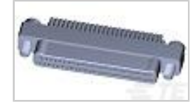
TMN2N051PC2DX036S = M32139/03-G03SNS