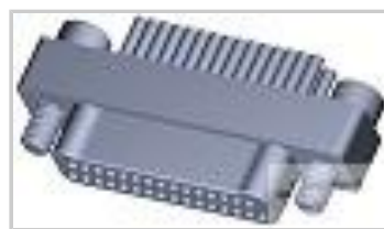
TMN2N031PC2DM018S = M32139/03-E05SNS