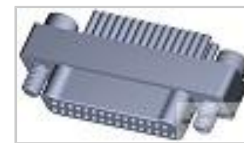
TMN2N031PC2DT018S = M32139/03-E08SNS