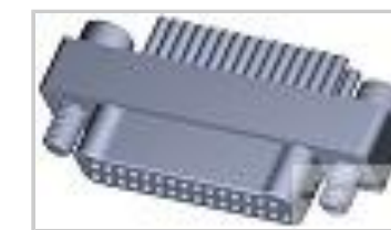
TMN2N031PC2DT036S = M32139/03-E09SNS