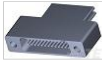
TMN2N025SC2DM018T = M32139/04-D05TNS