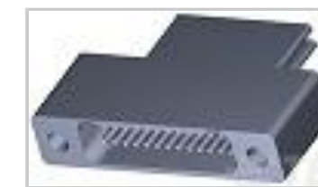
TMN2N025SC2DX018T = M32139/04-D02TNS