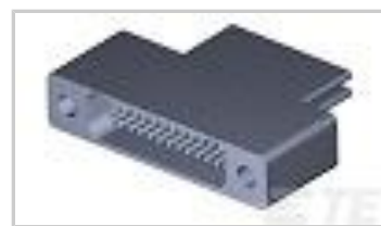
TMN2N025SC2DT036T = M32139/04-D09TNS