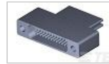
TMN2N025SC2DT006T = M32139/04-D07TNS