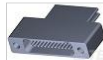
TMN2N025SC2DX006T = M32139/04-D01TNS