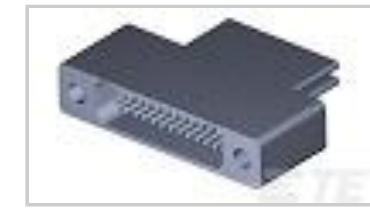
TMN2N025SC2DT018T = M32139/04-D08TNS