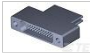
TMN2N025SC2DM036T = M32139/04-D06TNS