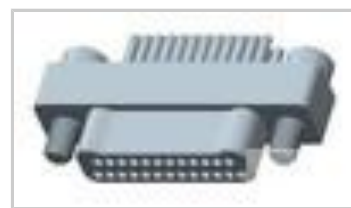
TMN2N025PC2DM018S = M32139/03-D05SNS