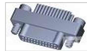
TMN2N025PC2TM018S = M32139/03-D11SNS