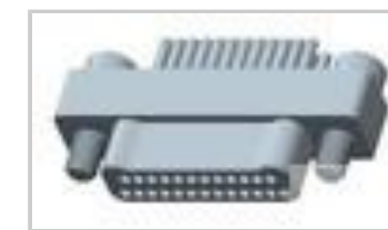
TMN2N025PC2DX018S = M32139/03-D02SNS