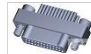
TMN2N025PC2DT018S = M32139/03-D08SNS