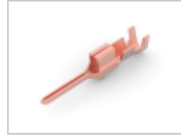
2.5 SIGNAL D/LOCK TAB CONT. L