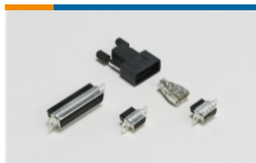
压接 D-Sub 连接器(10)