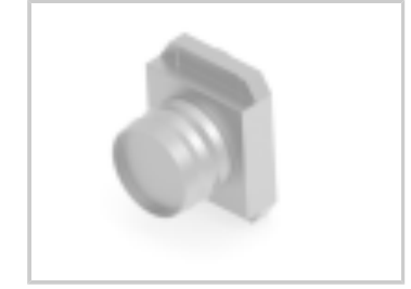
CRIMP FLANGE 13 LARGE