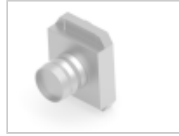
CRIMP FLANGE 10 LARGE