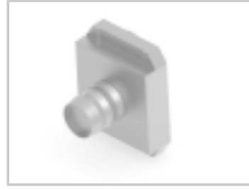
CRIMP FLANGE 6 LARGE