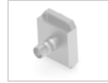
CRIMP FLANGE 3 LARGE