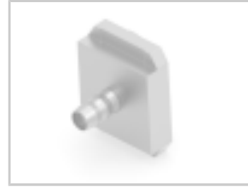
CRIMP FLANGES LARGE