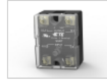
SSRT-240A10 = PANEL MOUNT, 10A, 240VAC