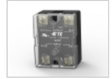
SSRT-240D25 = PANEL MOUNT, 25A, 240VAC