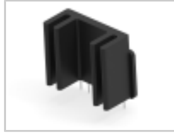
SSRF-240D25R=SIP MDLE, 25A,240VAC,R-INT H