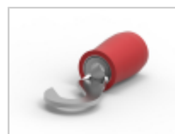
PIDG HK 22-16 COMM 22-18 MIL 6