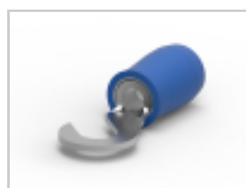
TERMINAL,PIDG HK 16-14 8