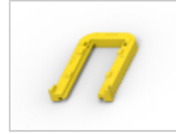
SLIDE,FOR 26POS TAB HSG