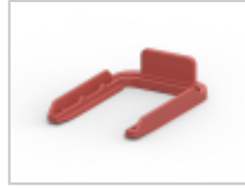
SLIDE,FOR TAB HOUSING, 15POS.