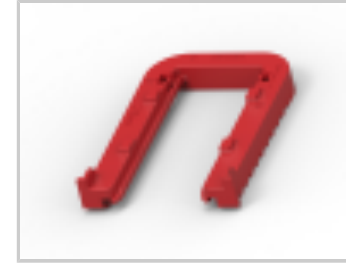
SLIDE,FOR 26POS TAB HSG