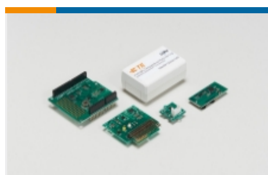
传感器开发板和评估套件(3)