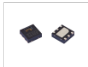
HTU20DF RH/T SENSOR W. FILTER