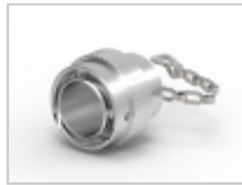
DUST CAP, 18SZ, REC, AL, LANYARD, HD30