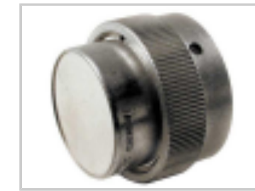
DUST CAP, 24SZ, REC, AL, NO LANYARD, HD30