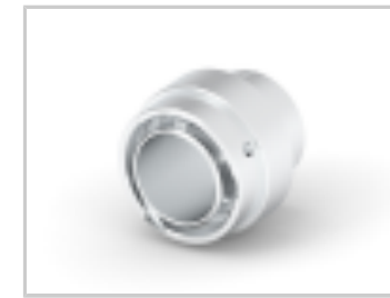
DUST CAP, 18SZ, REC, AL, NO LANYARD, HD30