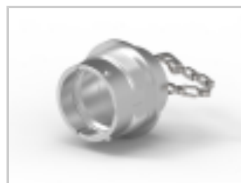
DUST CAP, 18SZ, PLG, AL, LANYARD, HD30