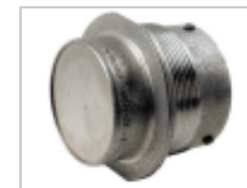
DUST CAP, 24SZ, PLG, AL, NO LANYARD, HD30