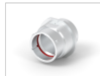
DUST CAP, 18SZ, PLG, AL, NO LANYARD, HD30