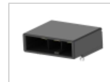
DYNAMIC D-5200 HDR H ASSY 3P