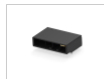
DYNAMIC D-5200S H-HDR ASSY 4P