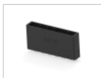
DYNAMIC D-5200 HDR ASSY 6P V X