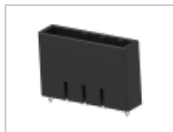
DYNAMIC D-5 S/ROW HDR ASY 4P V