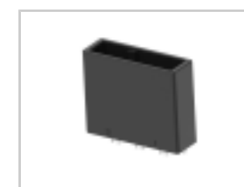
DYNAMIC D-5200 HDR V ASSY 3P