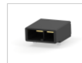
DYNAMIC D-5200 HDR H ASSY 2P