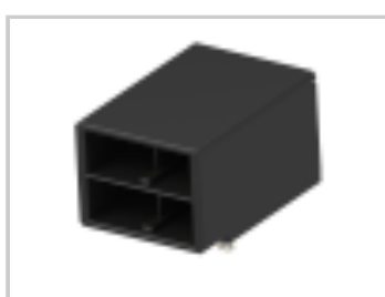
DYNAMIC D-5 HDR H ASSY 4P XX