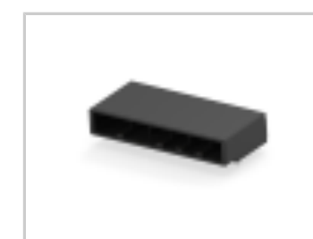
DYNAMIC D-5200 HDR ASSY 6P H X