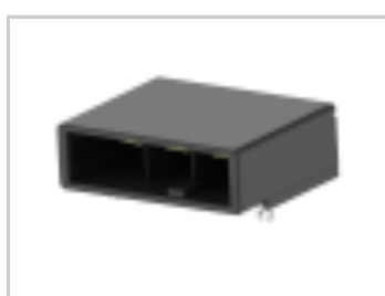
DYNAMIC D-5200 HDR H ASSY 3P