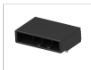
DYNAMIC D-5 S/ROW HDR ASY 4P H