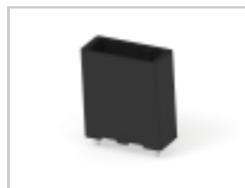
DYNAMIC D-5200 HDR V ASSY 2P