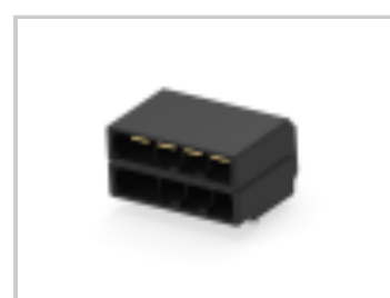
DYNAMIC D-5200 HDR H ASSY 8P