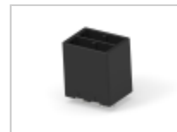
DYNAMIC D-5 V-HDR ASSY 4P Ag XX