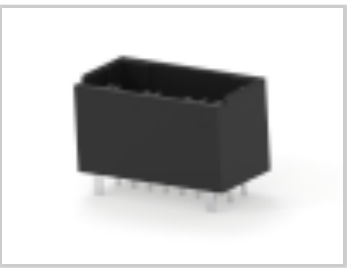
DYNAMIC 1200D HDR ASSY V 8P X BLACK GOLD