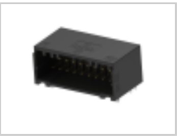
DYNAMIC 1200D HDR ASSY V 10PY BLACK GOLD