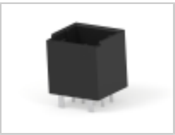
DYNAMIC 1200D HDR ASSY V 20PY BLACK GOLD