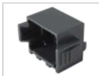
DUST CAP, 8P, PLG, BLK, DT