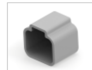
PROTECT CVR, 4P, REC, GRY, DT