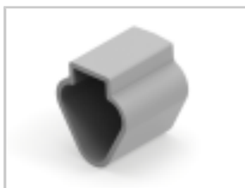
PROTECT CVR, 3P, REC, GRY, DT