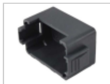
DUST CAP, 12P, PLG, BLK, DT