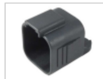
DUST CAP, 6P, PLG, BLK, DT