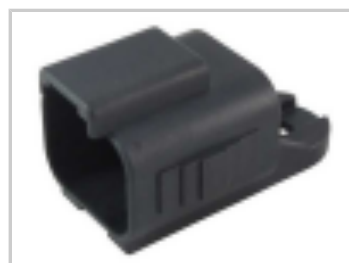
DUST CAP, 2P, PLG, BLK, DT