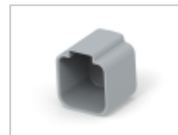
PROTECT CVR, 6P, REC, GRY, DT