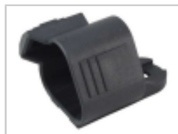
DUST CAP, 3P, PLG, BLK, DT