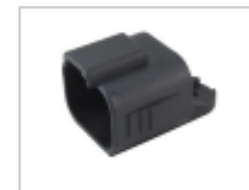
DUST CAP, 4P, PLG, BLK, DT