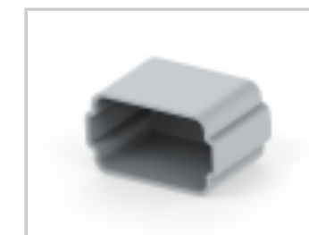
PROTECT CVR, 12P, PLG, GRY, DT