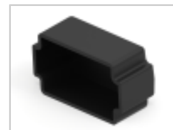
PROTECT CVR, 12P, REC, BLK, DT