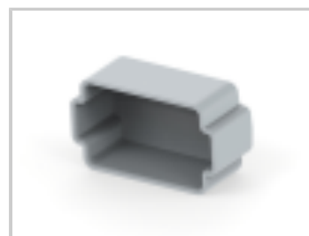
PROTECT CVR, 12P, REC, GRY, DT