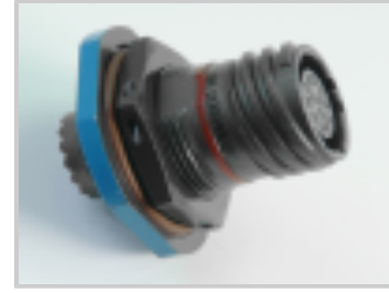
REC P ASSY