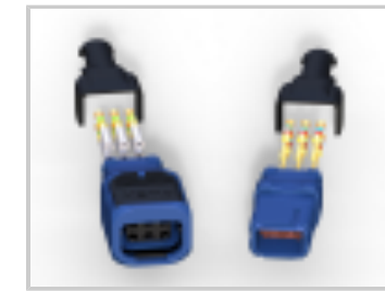
369 HARSH 6 WAY REC, CRIMP, SKT