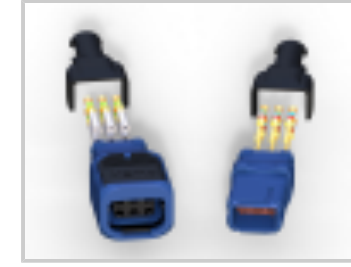
369 HARSH 6 WAY REC, 20 /22 AWG, PIN