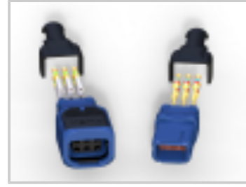
369 HARSH 6 WAY REC, 20 /22 AWG, SKT