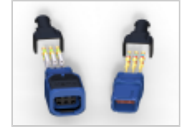
369 HARSH 6 WAY REC, SKT - BACC65CR2SA