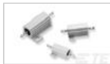
THS15 5K6 5%