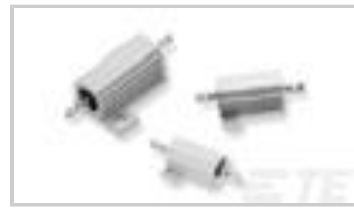
THS15 2R0 5%