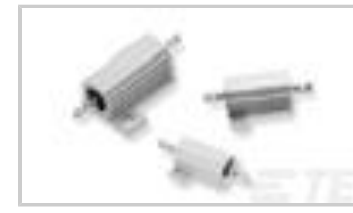
THS10 68R 5%